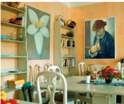
I den varma och ombonade miljön får både kvinnor och barn kraft att koncentrera sig på att tillfriskna.

Det är en mild vårvinterdag när vi besöker Rönneholms slott med de tre enheterna Prokrami Kvinnobehandling, Malins Minne och Lilla Malin. Det är lugnt och stilla så här mitt på dagen. De yngre barnen är på förskolan, som ligger i ett mindre hus på området, medan de äldre går i skolan i närbelägna Stehag. Under tiden fokuserar deras