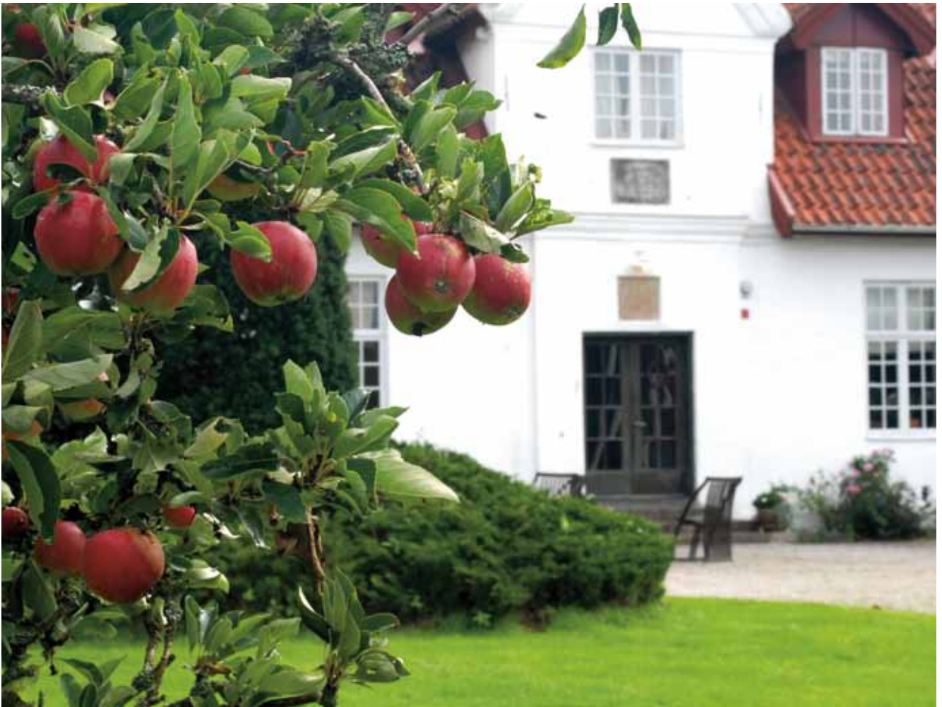
Malins Minne är inrymt i en byggnad som en gång i tiden var slottets orangeri. Huset är omgivet av lummig grönska och härlig gräsmatta som lockar till lek.